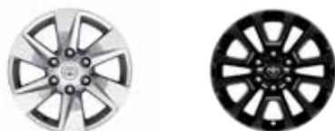
Comfort / Elegance Prestige / Premium

Lista de dotari constituie o selecție a celor mai importante dintre acestea. Toyota Centru Chișinău "Continental" își rezerva dreptul de a modifica prezența broșura ca urmare a unor erori, modificări structurale sau în urma unor comunicări din partea producătorului, fără nicio informare prealabilă. Garanția pentru autovehiculele Toyota: 3 ani sau 100.000 km. Consumul de carburant și emisiile de CO 2 ale unui autoturism depind nu doar de randamentul său energetic, ci și de comportamentul la volan și de alți factori care nu sunt de natură tehnică. Dioxidul de carbon (CO 2 ) este principalul gaz cu efect de seră responsabil pentru încălzirea planetei. Valid până la lansarea unei ediții actualizate.