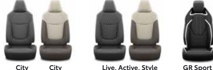
City City Live, Active, Style GR Sport