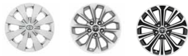
City / Live