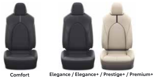
Comfort Elegance / Elegance+ / Prestige+ / Premium+