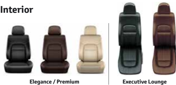
Elegance / Premium