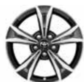
Active / Lounge / Premium