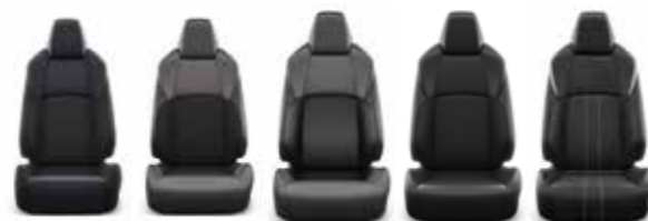
Active Lounge Premium Premium GR Sport