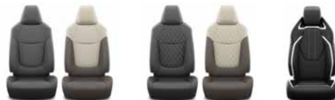
City City Live, Active, Style GR Sport