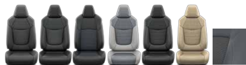
Live/Active Lounge Style Premium Premium Premium Black Edition