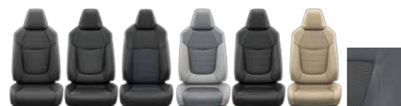
Live/Active Lounge Style Premium Premium Premium Black Edition