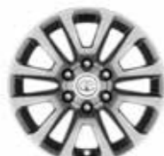
Prestige / Premium