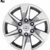
Comfort / Elegance