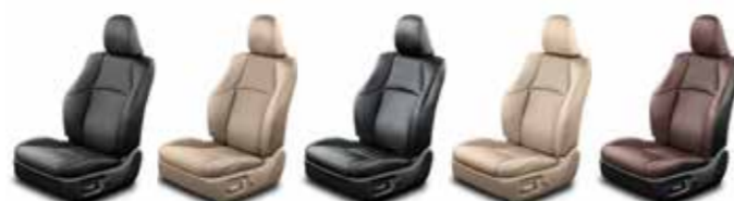
Comfort Prestige / Premium / Elegance Prestige