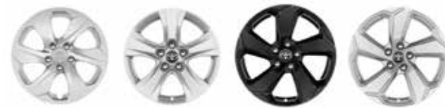
Live Active / Lounge Style Premium