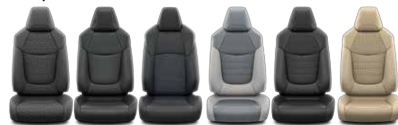
Live/ Active Lounge Style Premium Premium Premium