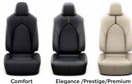
Comfort Elegance /Prestige/Premium