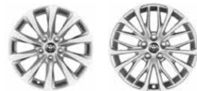
Comfort / Elegance / Prestige